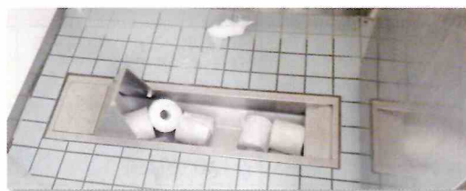
トイレトペーパーの詰め込み