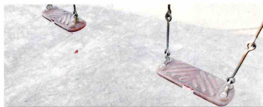
ブランコ腰板のいたずら